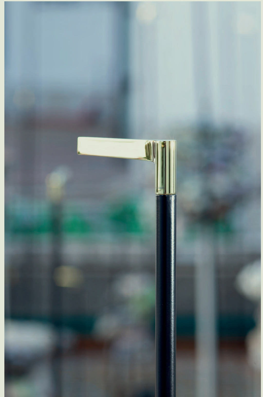
LAMA - Gio Ponti 1956