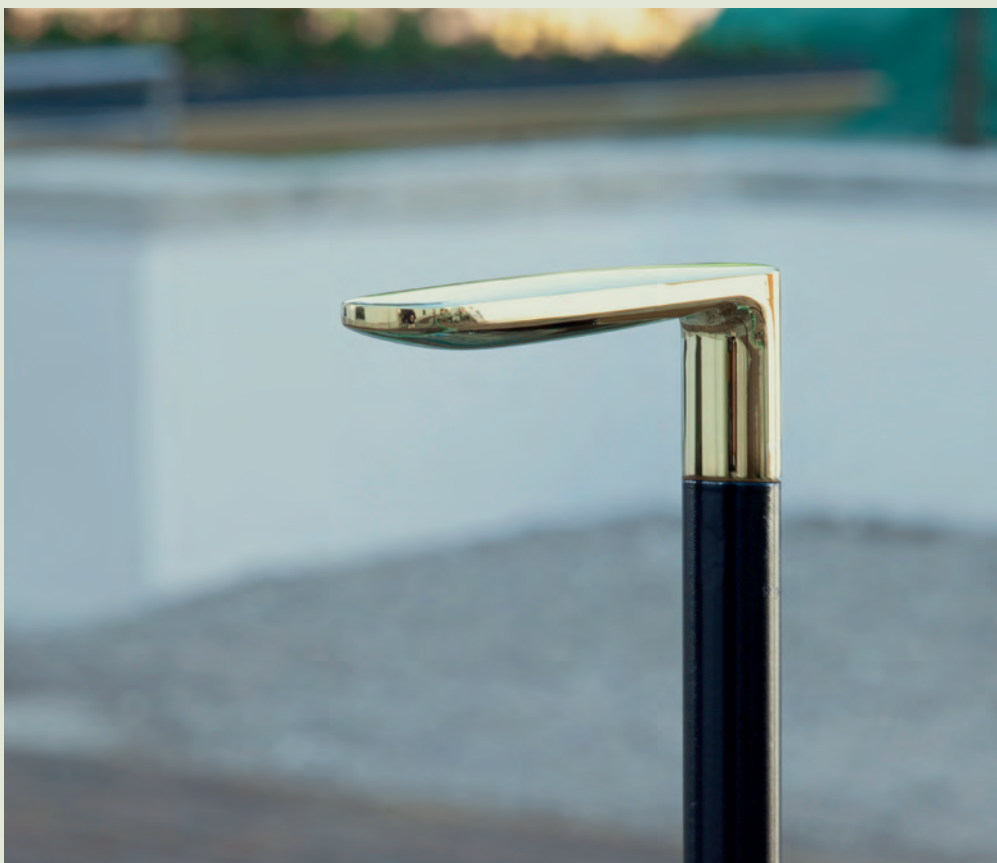
BRERA - Antonio Citterio 2025

Osservate insieme, queste maniglie mostrano proprio questa pluralità di linguaggi. Garda riflette il rigore e l'eleganza della tradizione modernista italiana; Lama sintetizza la capacità di ridurre la forma all'essenziale; Brera esprime una ricerca sull'equilibrio e sulla proporzione; Paddle introduce un linguaggio più fluido e contemporaneo; Icona restituisce invece una sensibilità più lineare e architettonica. Oggetti molto diversi tra loro, ma accomunati dalla volontà di trasformare un gesto quotidiano in una relazione consapevole con lo spazio.