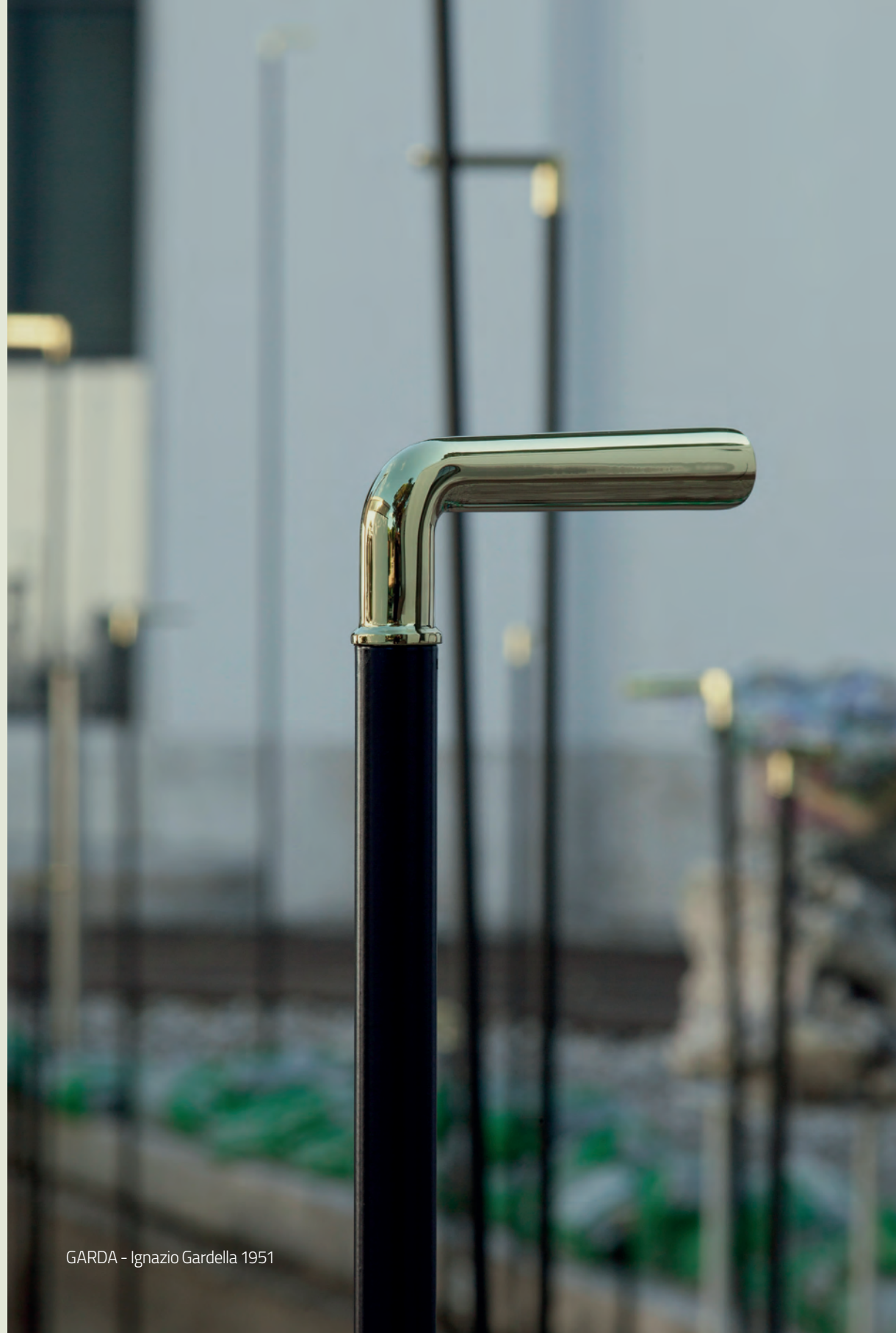
GARDA - Ignazio Gardella 1951