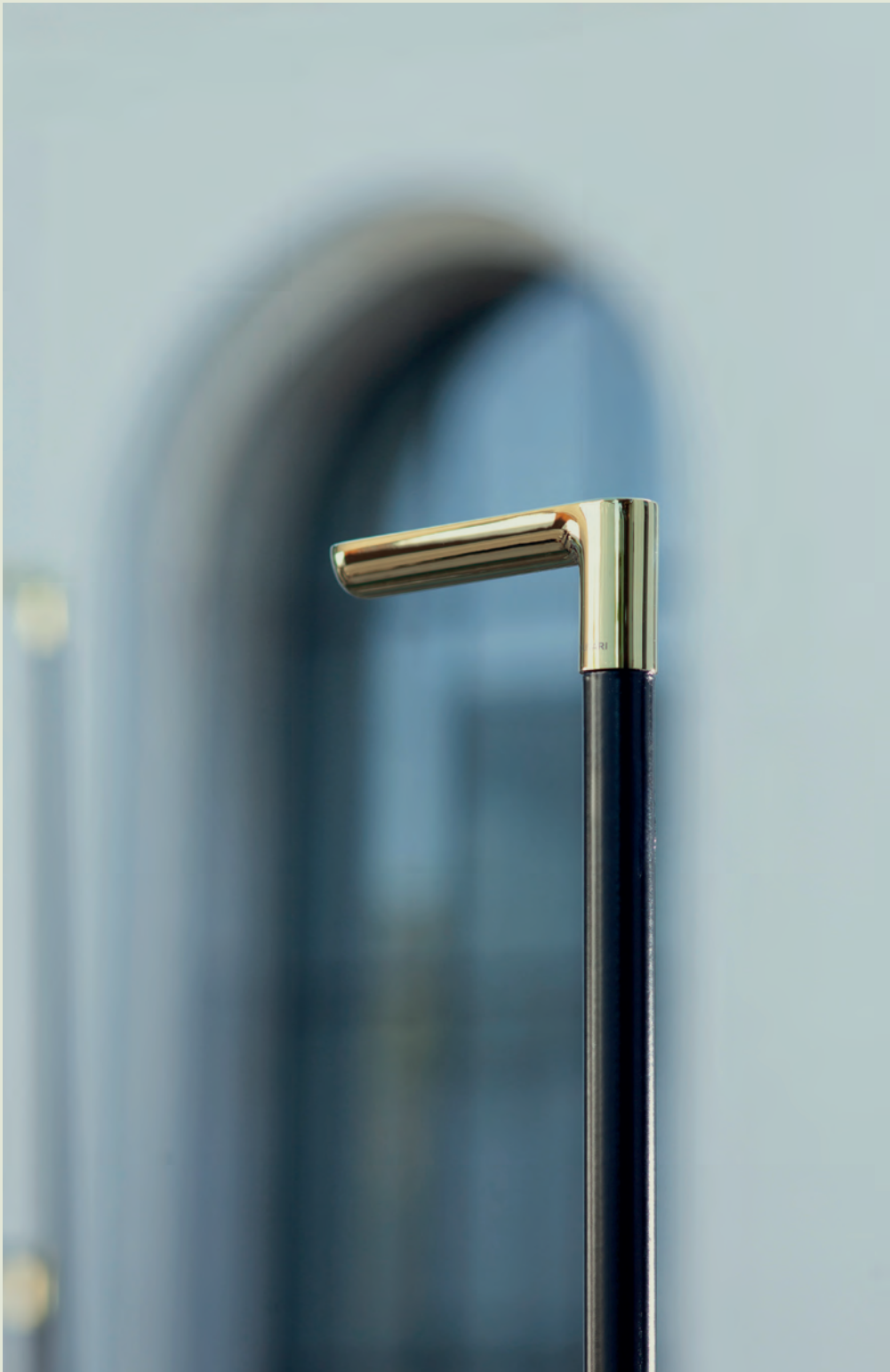
ICONA - Vincent Van Duysen 2018