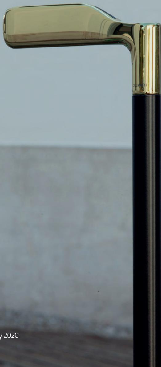
PADDLE - Barber Osgerby 2020

Per Olivari questa continuità non significa ripetizione, ma capacità di evolversi mantenendo un dialogo costante con il progetto. Nel corso del tempo l'azienda ha sviluppato competenze tecniche, conoscenza della materia e dei processi produttivi in grado di adattarsi a esigenze sempre diverse, mettendo la cultura industriale al servizio della libertà progettuale. È proprio questa disponibilità all'ascolto e alla collaborazione che consideriamo uno dei valori più importanti del nostro lavoro.