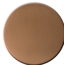
RS SuperRame satinato SuperCopper satin