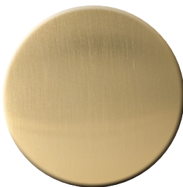
TS SuperOro satinato SuperGold satin