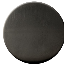
US SuperAntracite satinato SuperAnthracite satin