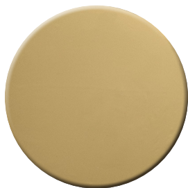
ZL SuperOro lucido SuperGold bright