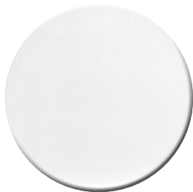
BP Bianco opaco Matt white RAL 9016