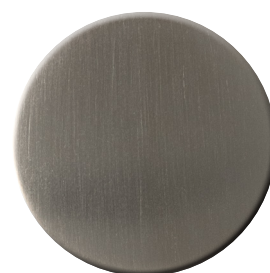
IS SuperInox satinato SuperStainlessSteel satin