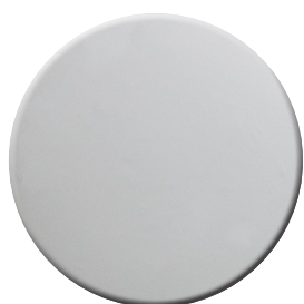
CR Cromo lucido Bright chrome