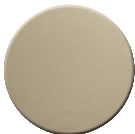
NL SuperNichel lucido SuperNickel bright