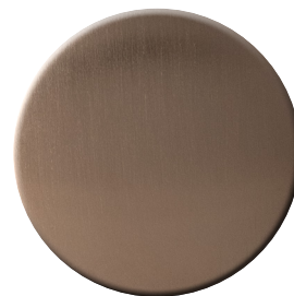
DS SuperBronzo satinato SuperBronze satin