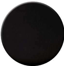
NP Nero opaco Matt black